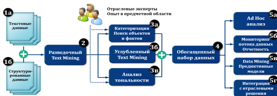
Рис. Типовая функциональная архитектура системы текстовой аналитики