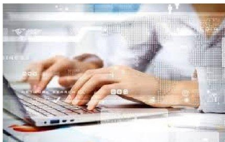
Рис. Медицинская диагностика

Тема 2.4.: Статистический анализ информации. Основные понятия статистики текста.