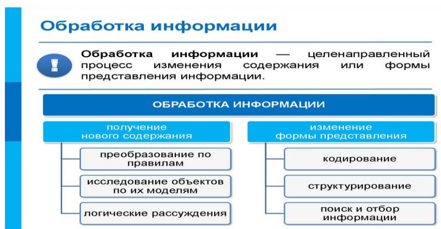
Рис. Обработка информации

Тема 2.2.: Сравнение больших массивов текстовых данных. Анализ книг и справочников.