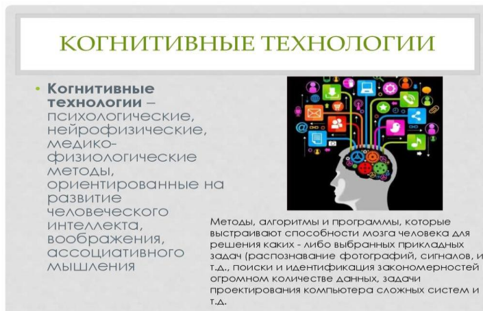
Рис. Понятие когнитивных технологий