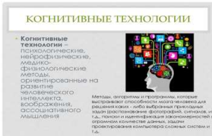
Рис. Понятие когнитивных технологий