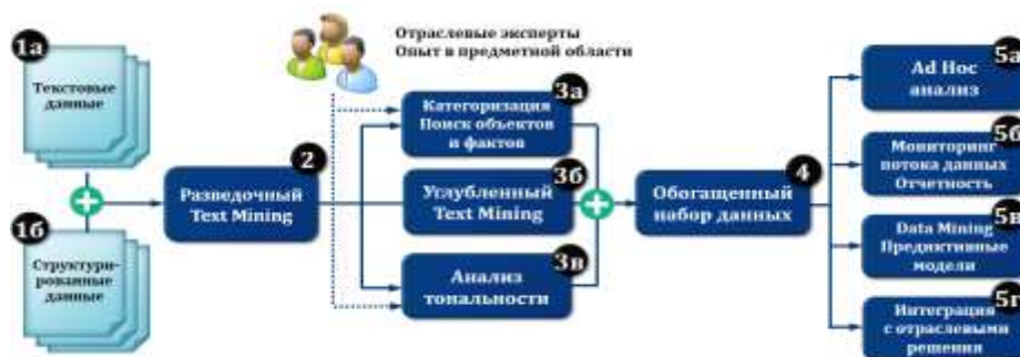
Рис. Типовая функциональная архитектура системы текстовой аналитики