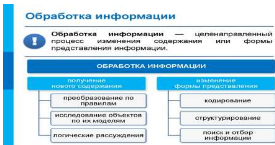
Рис. Обработка информации

Тема 2.2.: Сравнение больших массивов текстовых данных. Анализ книг и справочников.