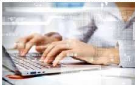
Рис. Медицинская диагностика

Тема 2.4.: Статистический анализ информации. Основные понятия статистики текста.